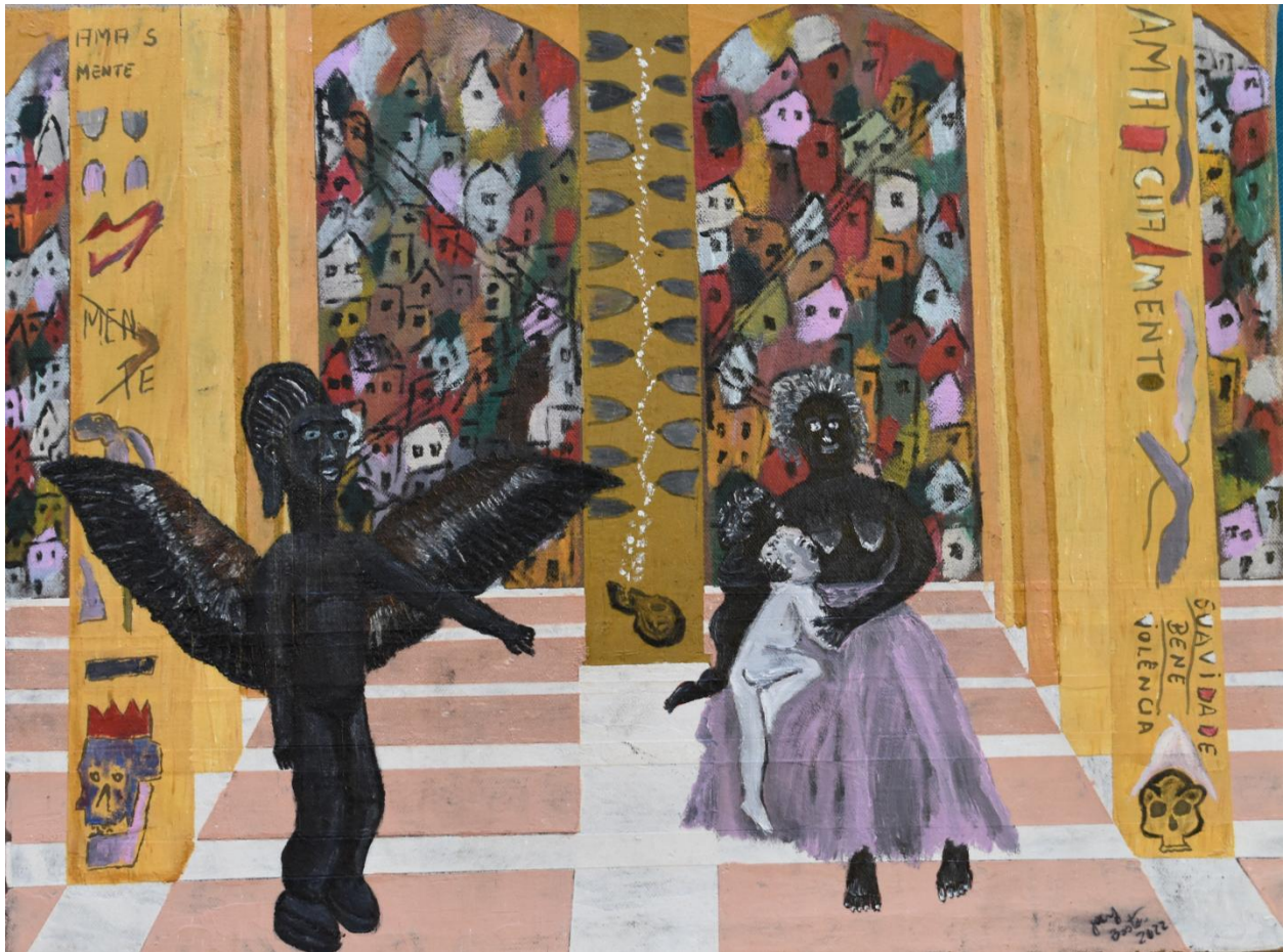
Anunciação - 2022 – 40 x 30 – Têmpera com terras, pigmentos e óleo sobre lona.