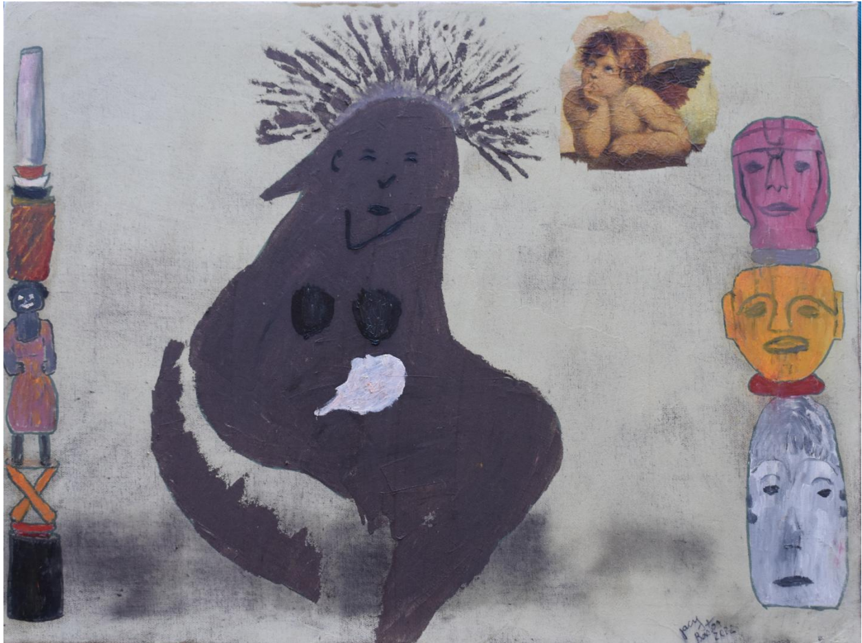
Futuro compartilhado? 2022 – 40 x 30 – Têmpera com terras, pigmentos, óleo e colagem sobre lona.