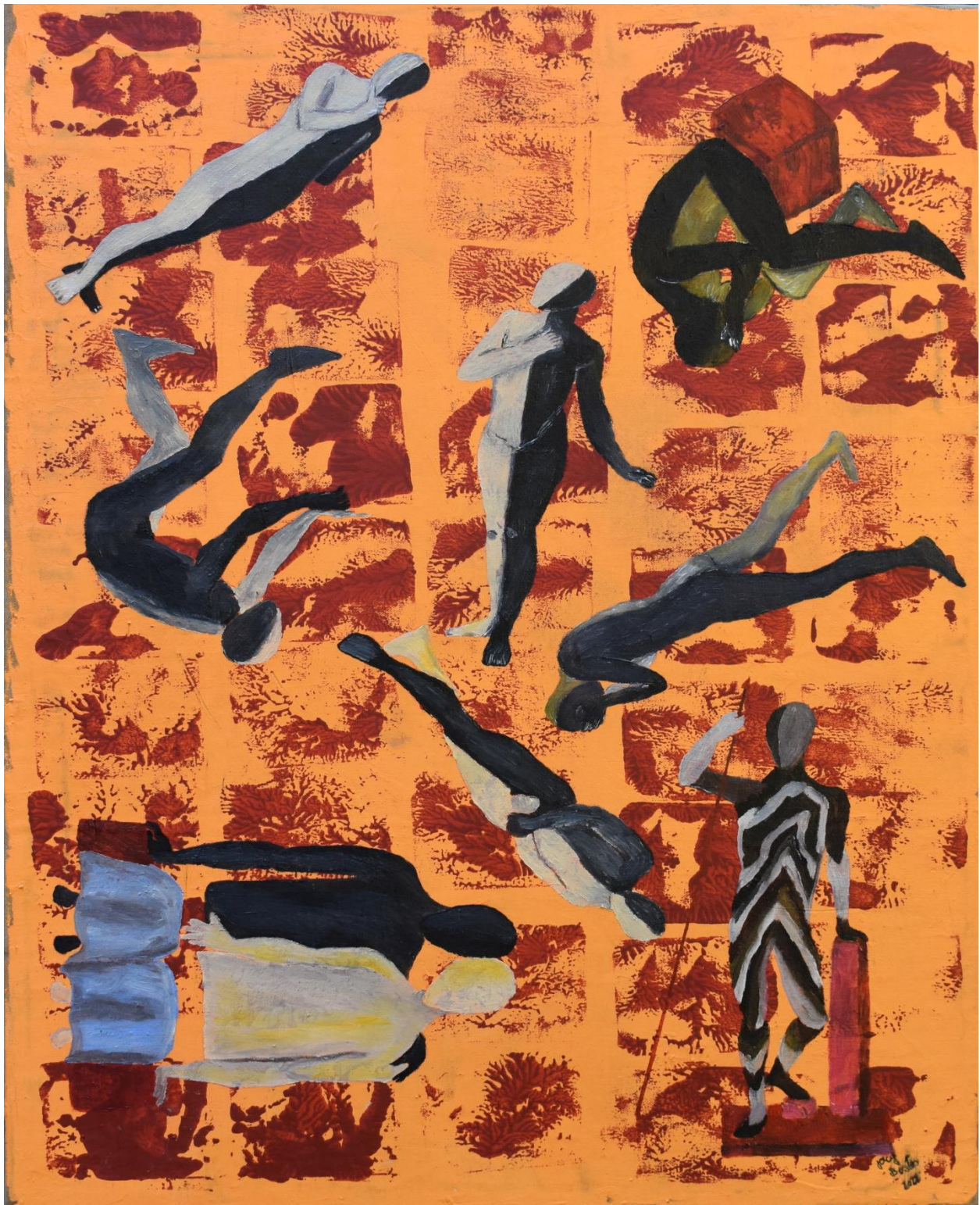
Fusão de corpos – 2022 – 70 x 50 – Têmpera com terras, pigmentos e óleo sobre lona.