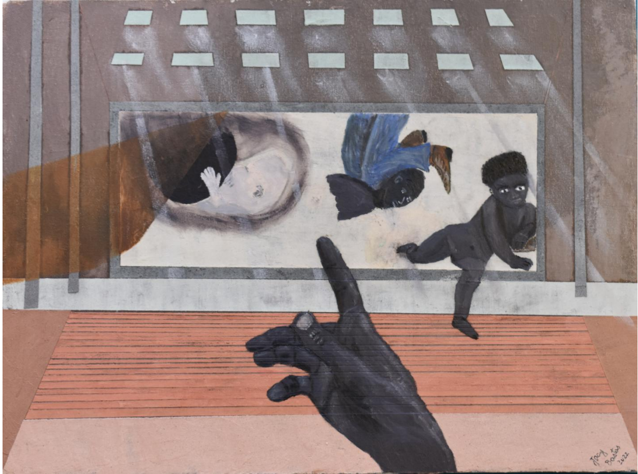
Resistência – século XXI - 2022 – 40 x 30 – Têmpera com terras, pigmentos e óleo sobre tela.