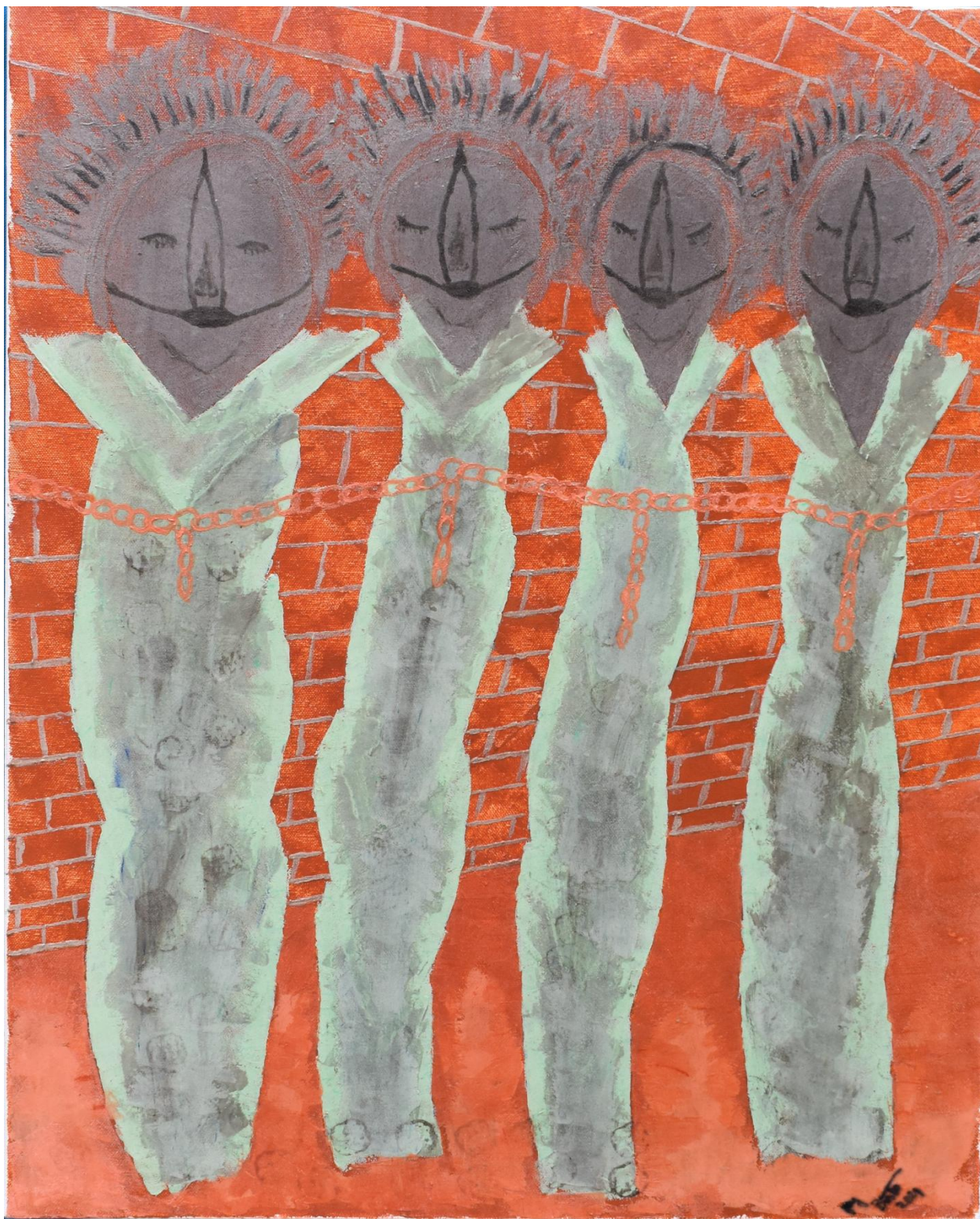
Separadas de seus mundos – 2021 – 70 x 50 – Têmpera com terras, pigmentos e óleo sobre tela