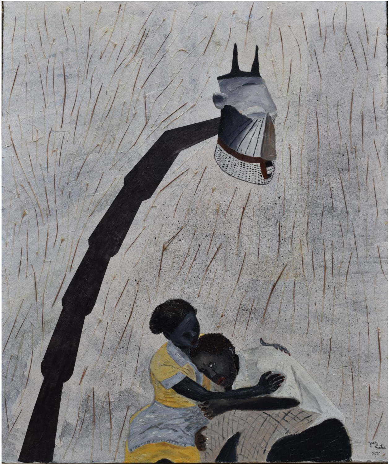
Colo mais quente – 2022 – 60 x 50 – Têmpera com terras, pigmentos e óleo sobre tela