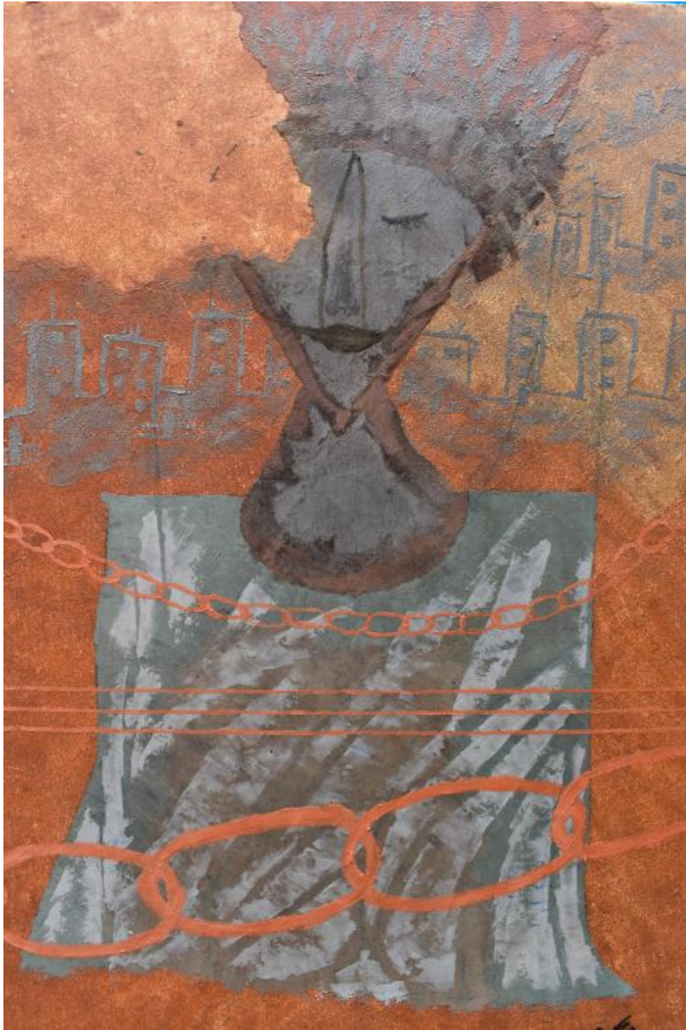
Mordaças e apagamentos – 2021 – 70 x 50 – Têmpera com terras, pigmentos e óleo sobre tela.