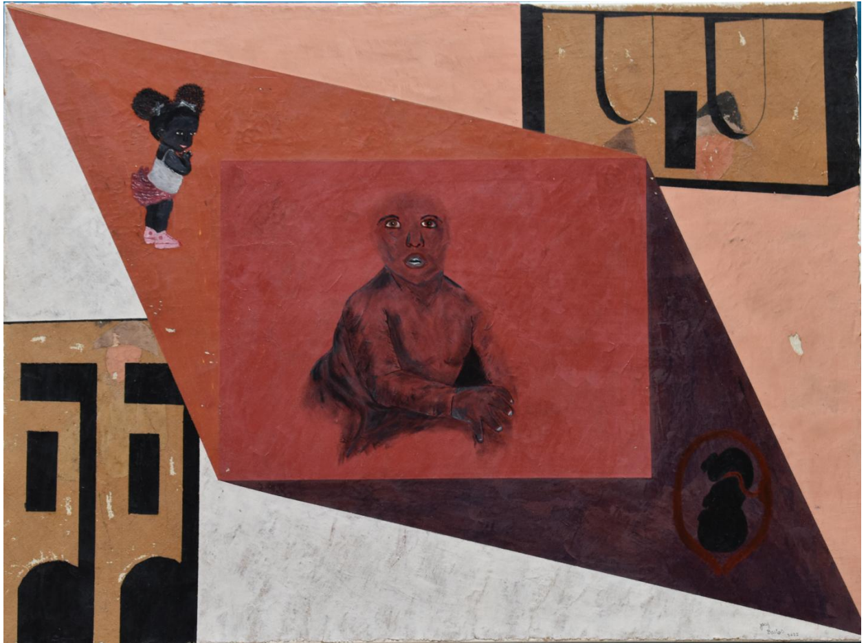
Bebês Legítimos – 2022 – 80 x 60 – Têmpera com terras, pigmentos e óleo sobre tela