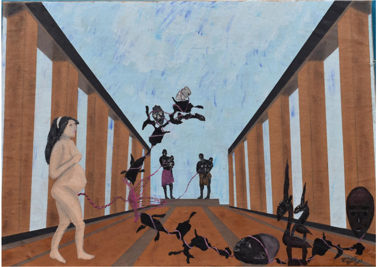
Medusa Placentária – 2022 – 70 x 50 – Têmpera com terras, pigmentos e óleo sobre lona.